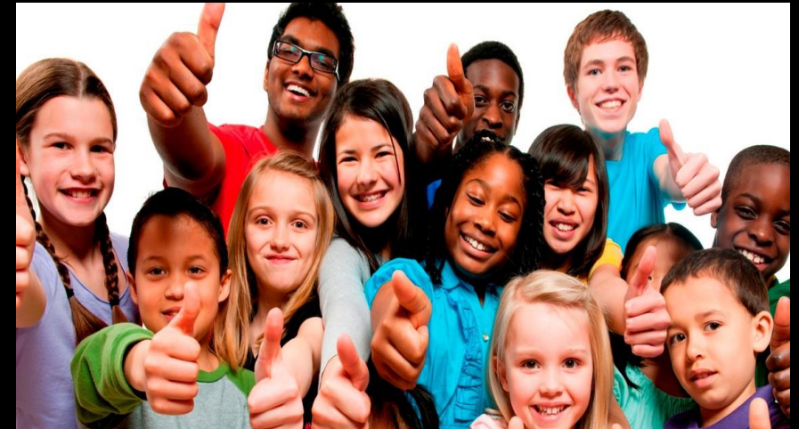
NIÑAS, NIÑOS Y ADOLESCENTES EJERCIENDO UN ROL PROTAGONICO