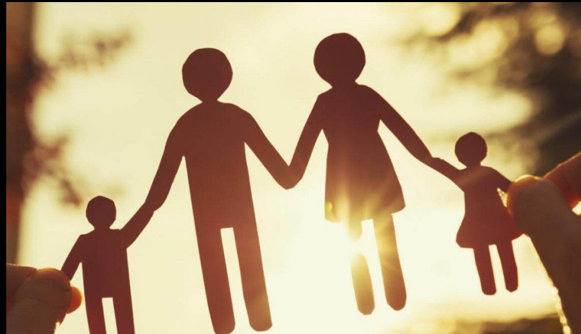
PROGENITORES-REFERENTES AFECTIVOS ACOMPAÑANDO AL HIJO/A