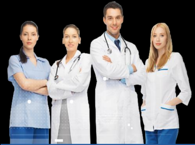
EQUIPO MÉDICO DEBER DE INFORMACIÓN